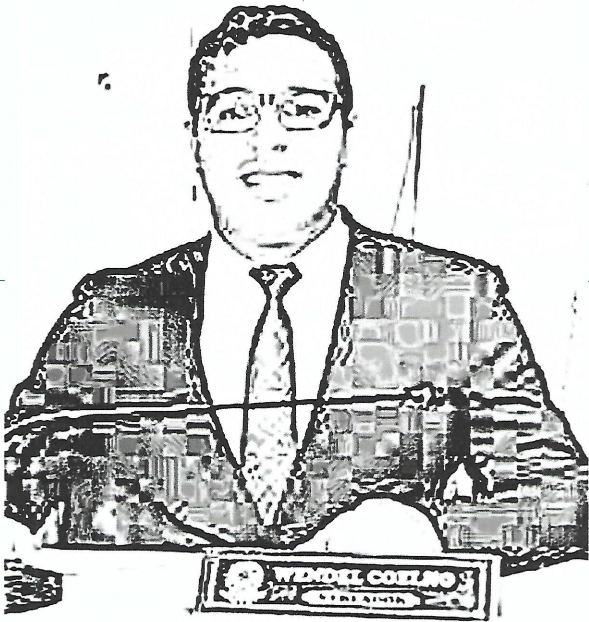
FRENTE DA MEDALHA